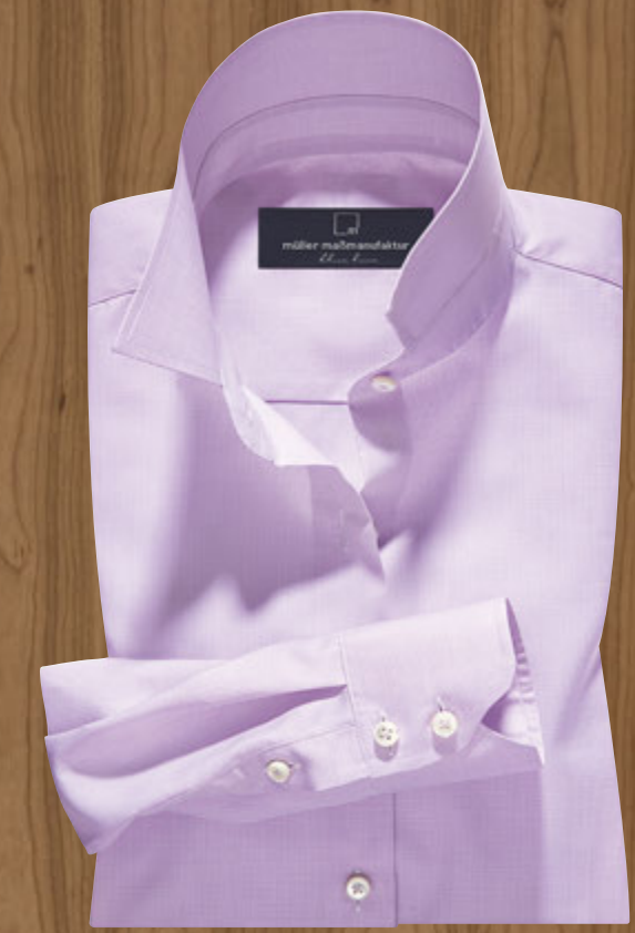
Maßbluse 2003/10: € 139,90 Kragenform 59 Hampton, Manschettenform 05 Zweiknopfmanschette Feinstes Strukturgewebe aus 100% Baumwolle, pflegeleicht