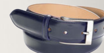
Herrengürtel Sattelleder Bleu 5917/00: € 149,00 Messingschließe, nickel glänzend, Gürtelbreite 3,5 cm