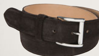
Premium Velourleder Moro 5906//00: € 169,00 Messingschließe, Nickel glänzend, Gürtelbreite 3,5 cm

Grubengegerbtes deutsches Rindsleder aus dem Rückenbereich der Kuhhaut (sog. „Croupons“)