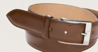
Herrengürtel Sattelleder Brown 5905/00: € 149,00 Messingschließe, nickel glänzend, Gürtelbreite 3,5 cm

Leder vom Rindersattel (der Rinder-rückenhaut) aus einer der letzten traditionellen Gerbereien in den englischen West Midlands.