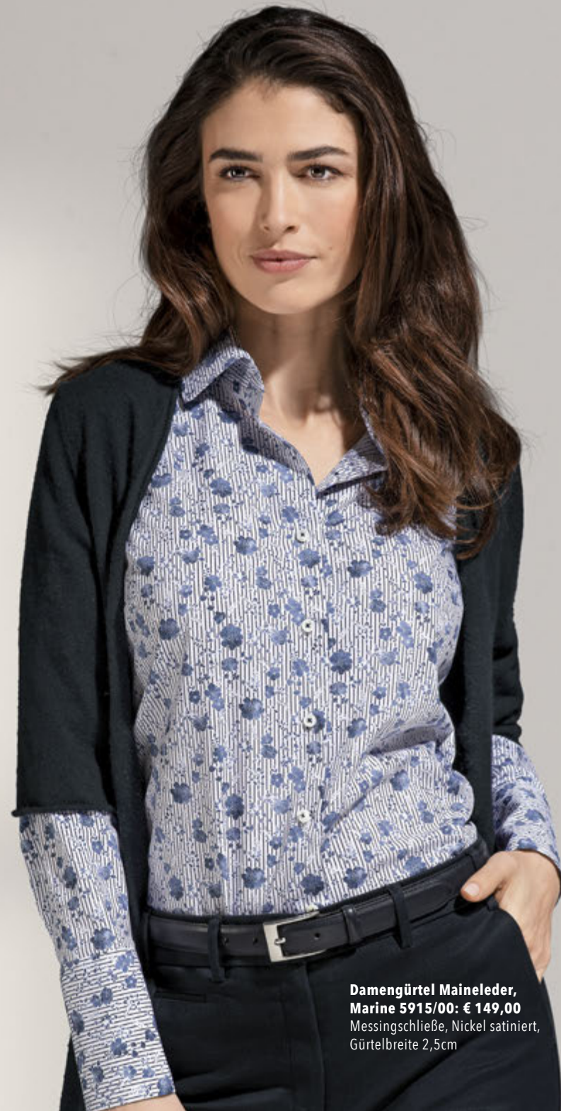
Damengürtel Maineleder, Marine 5915/00: € 149,00 Messingschließe, Nickel satiniert, Gürtelbreite 2,5cm