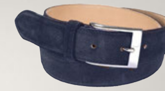
Premium Velourleder Marine 5921/00: € 169,00 Messingschließe, Nickel glänzend, Gürtelbreite 3,5 cm