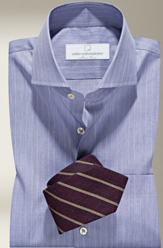
Maßhemd 2677/22: € 149,90 Kragenform 58 Napoli, Feinstwill in besonders hochwertiger Vollzwirnqualität aus 100% feinfädiger Baumwolle mit besten Trageeigenschaften, pflegeleicht