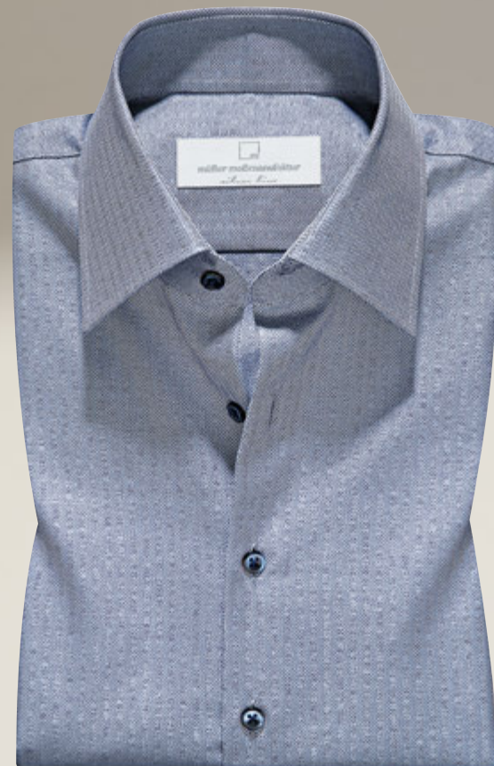
Maßhemd 2457/22: € 149,90 Kragenform 25 Wales, ein italienisches Fischgratgewebe in hervorragender Vollzwirnqualität, 100% feinsten Baumwolle, angenehmsten Trageigenschaften, pflegeleicht, blaue Knöpfe: Aufpreis € 5,50