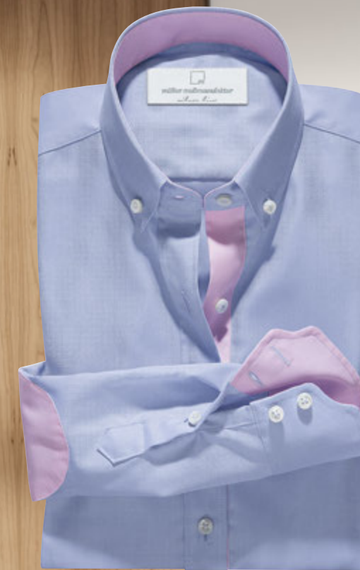
Maßbluse wie abgebildet: 3375/11 aus Basisdessin 2375/02: € 119,90, Vollwiroxfordgewebe aus 100% feinfädigster Baumwolle mit angenehmstem Tragekomfort und guten Pflegeeigenschaften. Kragenform 159 Button-down Hampton, Manschettenform 05 Zweiknopfmanschette, zzgl. Sonderverarbeitung: Kragenbündchen innen, Manschette innen, Untertritt und Ärmelpatch in Dessin 2375/10: € 21,00 Perlmutterknöpfe in italienischer Ausführung: Aufpreis € 9,50