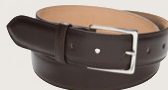
Herrengürtel Premium Kalbsleder, Mocca 5902/00: € 169,00 Messingschließe, Nickel glänzend, Gürtelbreite 3,5 cm