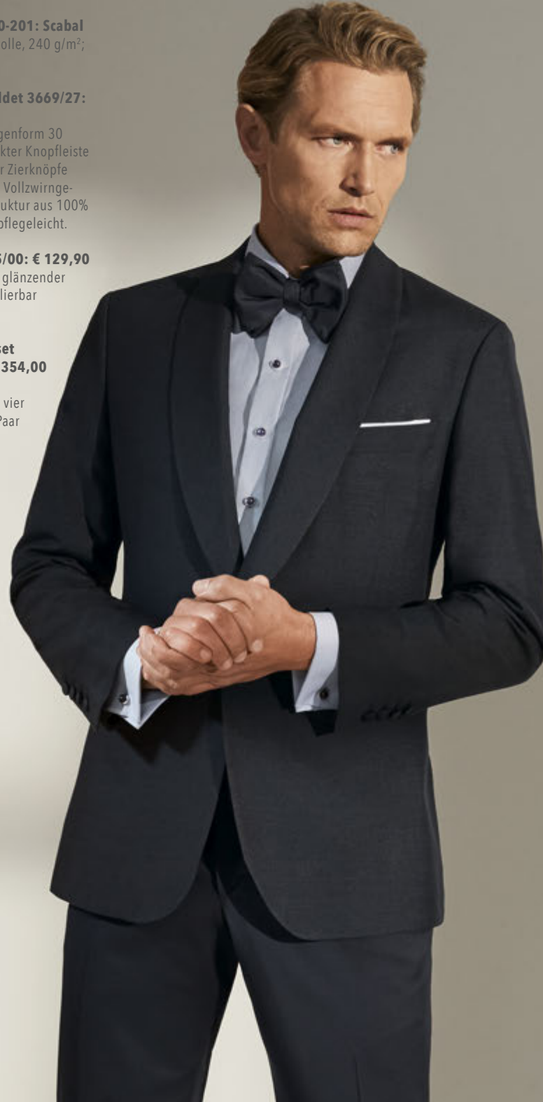
Smokinghemd-Knopfset schwarz 5406/00: € 1.354,00 aus 925er Sterlingsilber mit Iolith, bestehend aus vier Schmuckknöpfen und 1 Paar Manschettenknöpfen