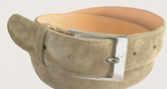
Premium Velourleder Tabak 5920//00: € 169,00 Messingschließe, Nickel glänzend, Gürtelbreite 3,5 cm