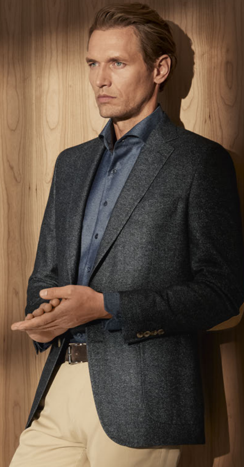
Maßsakko K90-007: Loro Piana, 71% Schurwolle, 29% Leinen, 295 g/m 2 , ab € 749,00