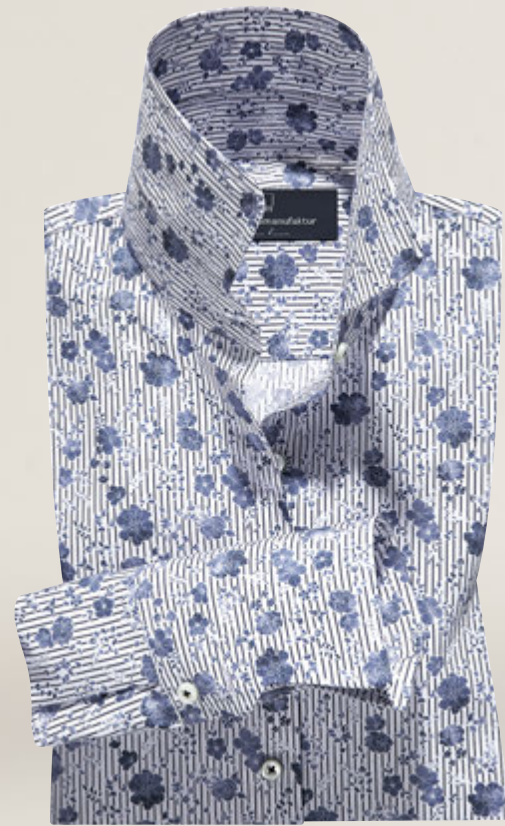
Maßbluse 2005/21: € 129,90 Modisches Druckdessin aus 100% feinsten Baumwolle, pflegeleicht Kragenform 04 Paris, Manschettenform 10 franz. Manschette

Ob Casual-Chic oder Luxus-Look – mit Auswahl der Verarbeitungsdetails legen Sie den Stil Ihrer persönlichen Maßbluse immer selbst fest. Mit aufgesetzten Ärmelpatches verleihen Sie Ihrer Maßbluse eine sportiv-lässige Optik. Sie möchten Ihre Blusen gerne lässig und im Rumpf etwas weiter geschnitten haben (ohne Abbildung). Dann vermerken Sie bitte auf Ihrem Bestellschein „ohne Taillebenäher“.