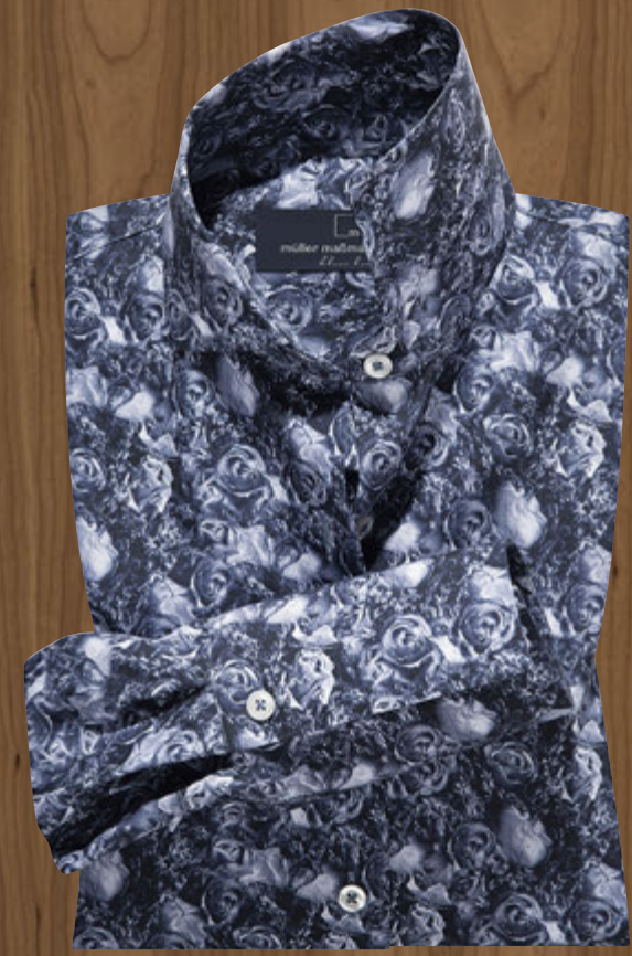
Maßbluse 2005/27: € 129,90 Kragenform 72 Modena, Manschettenform 11 italienische Manschette Modisches Druckdessin aus 100% feinster Baumwolle, pflegeleicht

Ein leichter Griff, feinste Baumwollgarne und liebevolle Details verleihen diesen Maßblusen ihre feminine Schönheit. Sie lassen sich unkompliziert zu den verschiedensten Outfits kombinieren und punkten mit perfekter Passform, sorgfältig nach Ihren persönlichen Maßen geschneidert.