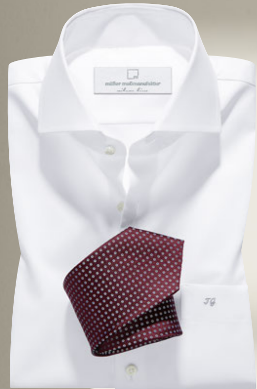
Maßhemd 2669/01: € 149,90 Kragenform 58 Napoli, hochwertiges Vollzwirngewebe mit feinsten Webstruktur aus 100% ägyptischer Baumwolle, pflegeleicht. Perlmutterknöpfe in italienischer Ausführung: € 9,50