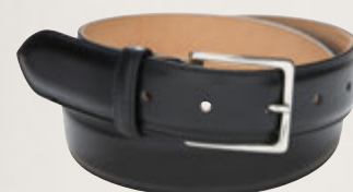
Herrengürtel Premium Kalbsleder, Schwarz 5901/00: € 169,00 Messingschließe, Nickel glänzend, Gürtelbreite 3,5 cm

Kalbsleder in Premiumqualität aus der oberpfälzer Gerberei Perlinger mit handgearbeitetem Glanzfinish