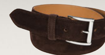
Premium Velourleder Mocca 5907/00: € 169,00 Messingschließe, Nickel glänzend, Gürtelbreite 3,5 cm