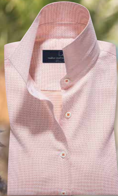
Maßbluse 3272/50: Basispreis € 109,90 aus Dessin 2272/50, Kragenform 72 Modena, Manschettenform 05 Zweiknopfmanschette, zzgl. der Sonderverarbeitung : Knopfannäharbe Blutorange: € 3,50 modisches 100% Baumwollgewebe aus Österreich, mit aufwändigen Webstrukturen, pflegeleicht.

Hier abgebildet mit zwei besonderen Stilvorschlägen: Einer aus dem Blusenstoff gefertigten Schluppe und Umschlagmanschette mit Manschettenknopf.