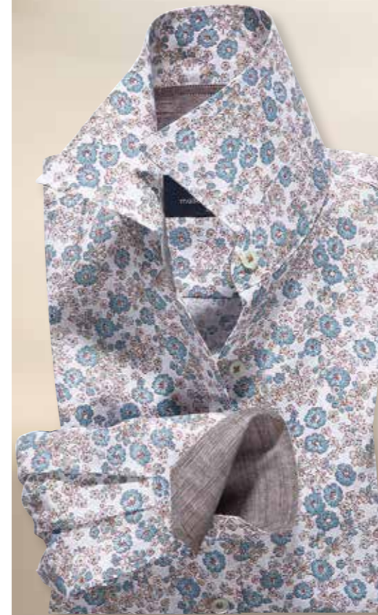
Maßbluse 3263/02: Basispreis € 119,90 aus Dessin 2263/02 Kragenform 57 Modena, Manschettenform 16 englische Man- schette, zzgl. der Sonderverarbeitungs- details: Kragenbündchen innen und Manschette innen in Dessin 2033/31 gearbeitet: € 8,50; 60% reines Leinen, 40% Baumwolle, pflegeleicht.