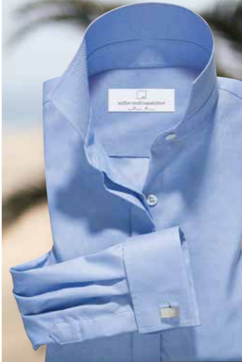
Manschettenknopf 5359/00: € 45,00