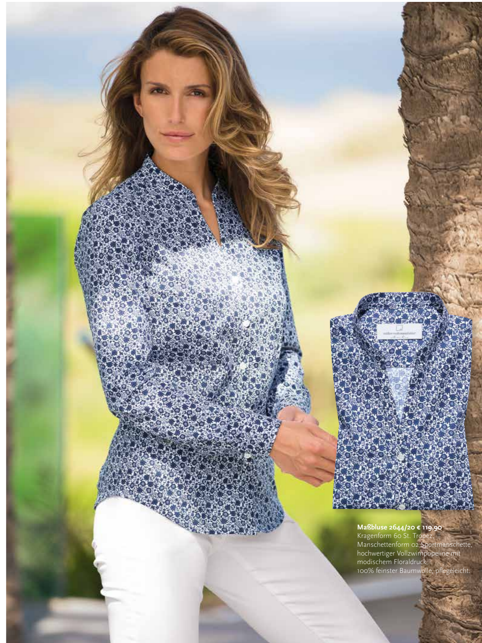
Maßbluse 2644/20 € 119,90 Kragenform 60 St. Tropez, Manschettenform 02 Sportmanschette, hochwertiger Vollzwirnpopeline mit modischem Floraldruck, 100% feinsten Baumwolle, pflegeleicht.