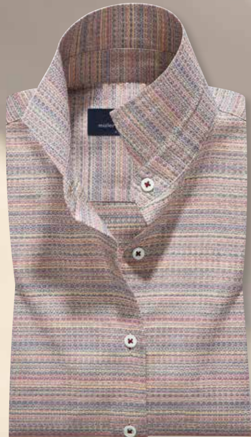
Maßbluse 3269/30: Basispreis € 119,90 aus Dessin 2269/30 Kragenform 72 Modena, Ärmelverarbeitung 18 Krempelarm mit Lasche, zzgl. der Sonderverarbeitung Knopfannähefarbe Bordeaux: € 3,50 60% reines Leinen, 40% Baumwolle, pflegeleicht.

Ein Sommertraum in gewaschenem und knitterarmem Gewebe aus kühlendem Leinen und hautsympathischer Baumwolle. In den schönen, sommerlichen Melange-Farben wirken diese Maßblusen besonders attraktiv.