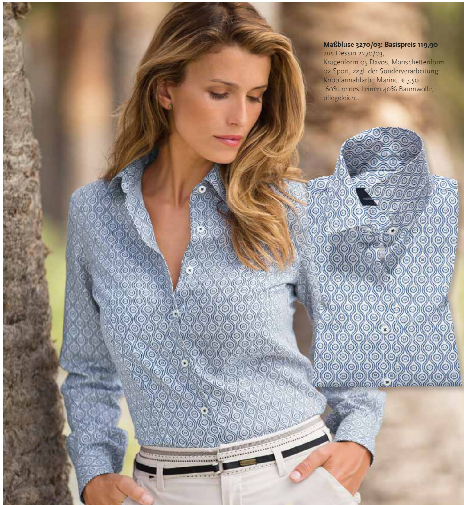
Maßbluse 3270/03: Basispreis 119,90 aus Dessin 2270/03, Kragenform 05 Davos, Manschettenform 02 Sport, zzgl. der Sonderverarbeitung: Knopfannähsfarbe Marine: € 3,50 60% reines Leinen 40% Baumwolle, pflegeleicht.

Ein Basic der Sommergarderobe mit souveräner Eleganz: Die klassische Hemdbluse aus reinem Leinen oder einem Leinen-Baumwollgemisch. Edel in der Aussage, komfortabel im Charakter und sommerlich kühl im Komfort. Wertvoll in der Verarbeitung: der schlichte Style mit klassischem Hemdblusenkragen, durchgehender Knopfleiste und schmalem Langarm mit klassischer Manschette. Zwei Hemdblusen, die mit selbstverständlicher Klasse den souveränen Auftritt moderner Frauen unterstreichen.