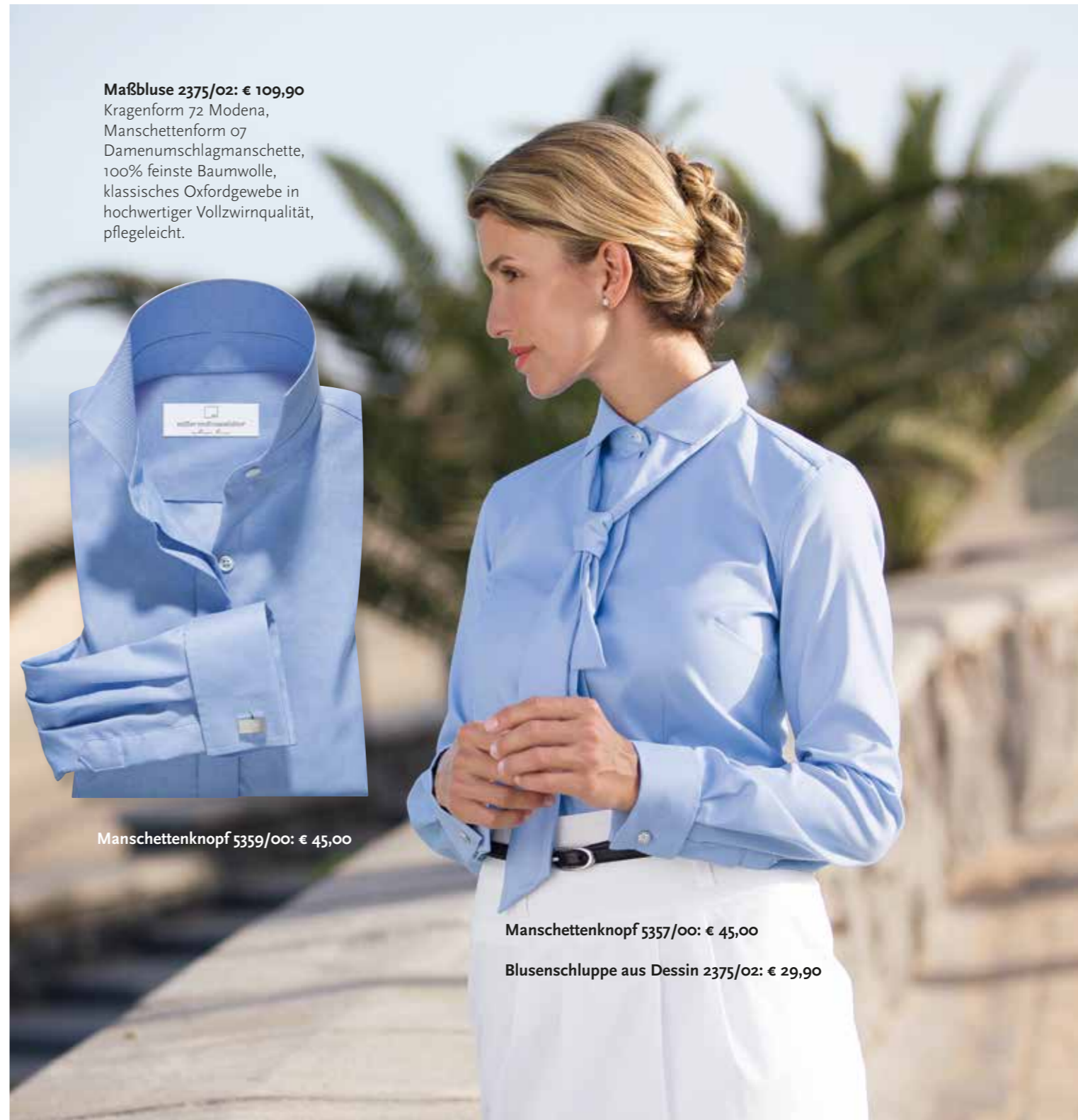
Maßbluse 2375/02: € 109,90 Kragenform 72 Modena, Manschettenform 07 Damenumschlagmanschette, 100% feinste Baumwolle, klassisches Oxfordgewebe in hochwertiger Vollzwirnqualität, pflegeleicht.